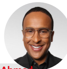
Dr. Nasser Ahmed SPD-PARTEIVORSITZENDER UND STADTRAT

Was folgt nach den beeindruckenden Massenprotesten gegen den Rechtsruck und für Demokratie? Darum soll es in diesem Forum gehen. Weltweit gerät die Demokratie derzeit unter Druck, autoritäre Herrscher bekommen Zulauf, rechtsextremistische Parteien wie die AfD sind in den Parlamenten und vermeintlich „einfache Lösungen“ werden gesucht.